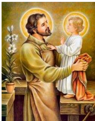
Sv. Francišek Saleški

TI ZMOREŠ VSE: Slavni sveti Jožef, ženin Device Marije, pri srcu Jezusa Kristusa te prosimo, nakloni nam svoje očetovsko varstvo. Ti, ki spričo naših potreb zmoreš vse in ki znaš narediti mogoče tiste stvari, ki se nam zdijo nemogoče, ozri se s svojimi očetovskimi očmi na potrebe svojih otrok. V trpljenju in negotovosti, ki nas stiskata, se z zaupanjem obračamo nate. Prosimo te, bodi naš vodnik v odgovornih in zapletenih življenjskih okoliščinah, ki nam povzročajo nemir, in stori, da bo dober razplet v slavo Boga in v korist tvojih vdanih služabnikov.